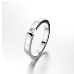
Spannring mit einem Stein, polierte Oberfläche