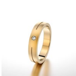
Ring mit einem Stein, mattierte Oberfläche, mit mittig gesetzter Rille

Alle Materialien und Profile sind frei kombinierbar. Materialhöhe und Breite Ihres Profils bestimmen Sie. Die abgebildeten Profile, Steine und Ringe sind nur eine kleine Auswahl. Weitere Beispiele zeige ich euch gerne in meiner Werkstatt.