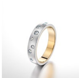
zweifarbiger Ring mit mehreren Steinen, mattierte Oberfläche