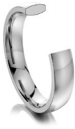
Weißgold oval mit abge- flachten Seiten