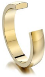
Gelbgold innen flach, außen rund, ab- geflachte Seiten