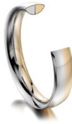
Bicolor innen rund, außen halbrund