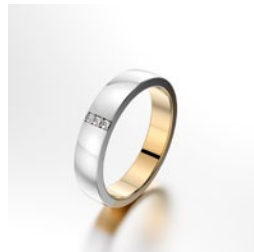
Ring mit mehreren Steinen in Kanalfassung, polierte Oberfläche