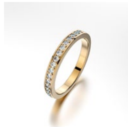
Pavé Reihenfassung mit mehreren Steinen