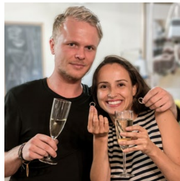
Das Ergebnis: Die Ringe sind nun passgenau und wunderschön.