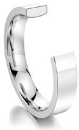
Material: Profil: Platin vierkant, innen bombiert