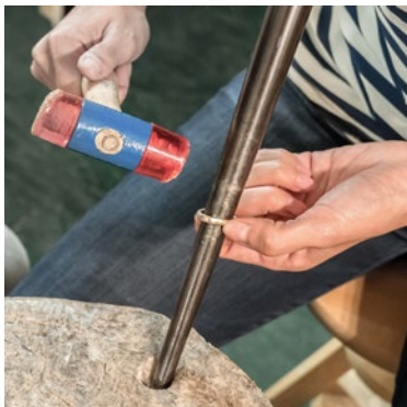
Die Ringe werden nun rund geschmiedet.